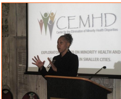
Dr. Joy DeGruy

Con el apoyo de CEMHD, la Dra. Joy DeGruy, autora de Post Traumatic Slave Syndrome , llevó a cabo un taller de medio día el 19 de noviembre. El acontecimiento estuvo auspiciado por la iglesia Macedonia Baptist Church, el Capítulo de Albany del Black Child Development Institute (Instituto de